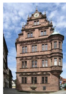
Weinstube Iselin im alten Rathaus Gernsbach Weblink: http://weingutiselin.com/

Anschließend bietet sich die Möglichkeit, im Weingut Iselin im alten Rathaus in außergewöhnlichem Ambiente einen Imbiss zu genießen (Kosten für den Imbiss: EUR 10,-; Getränke werden extra berechnet)