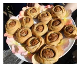
Abb. sind unverbindliche Beispiele