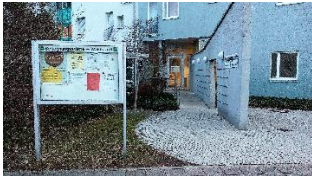
Eingang Vortragsraum gegenüber Straßenbahnhaltestelle

NHV Vortragsraum in der Begegnungsstätte Waldstadt Glogauer Str. 10, 76139 Karlsruhe-Waldstadt