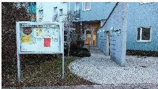
Eingang Vortragsraum gegenüber Straßenbahnhaltestelle

Glogauer Str. 10, 76139 Karlsruhe-Waldstadt